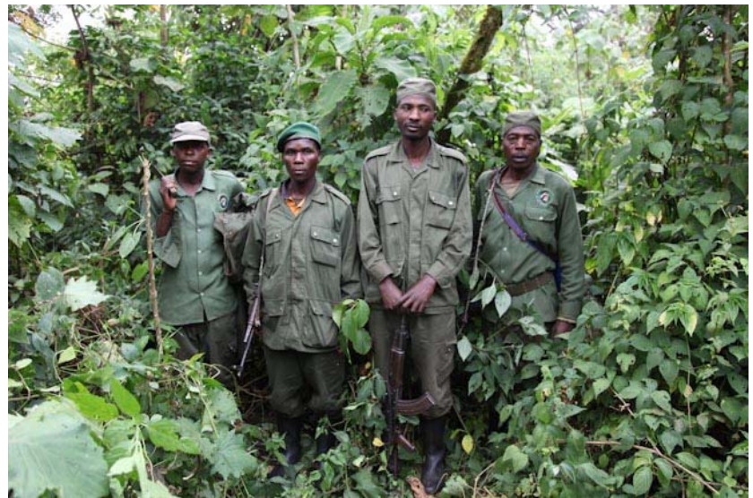
Meine Truppe, für einen einzigen Touri, einen Führer und vier bewaffnete Scouts.