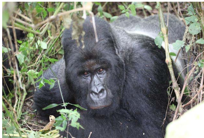
Wir haben die Gorilla Familie Mepuwa gefunden, begrüßt werden wir sogleich mit dem Chef, dem Silberrücken. Es ist einfach einzigartiges Erlebnis!!!