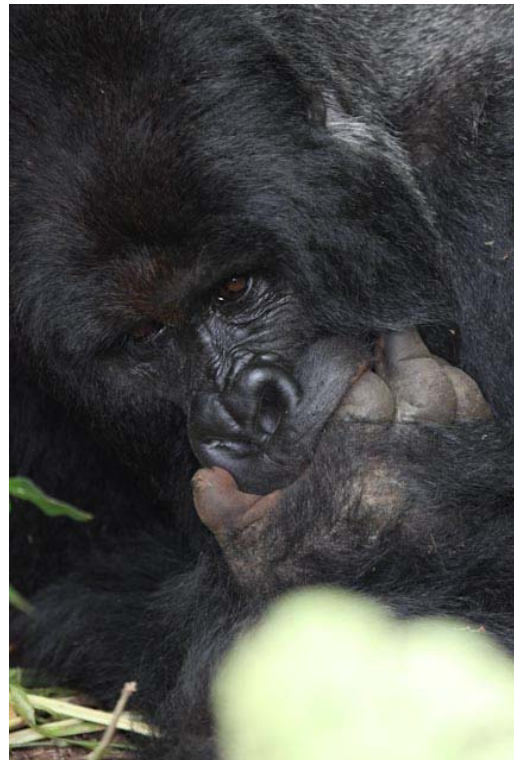
Hab's noch nicht, mal sehen ob ich es