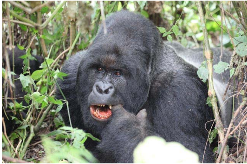
Mal fühlen, ob es jetzt besser ist.