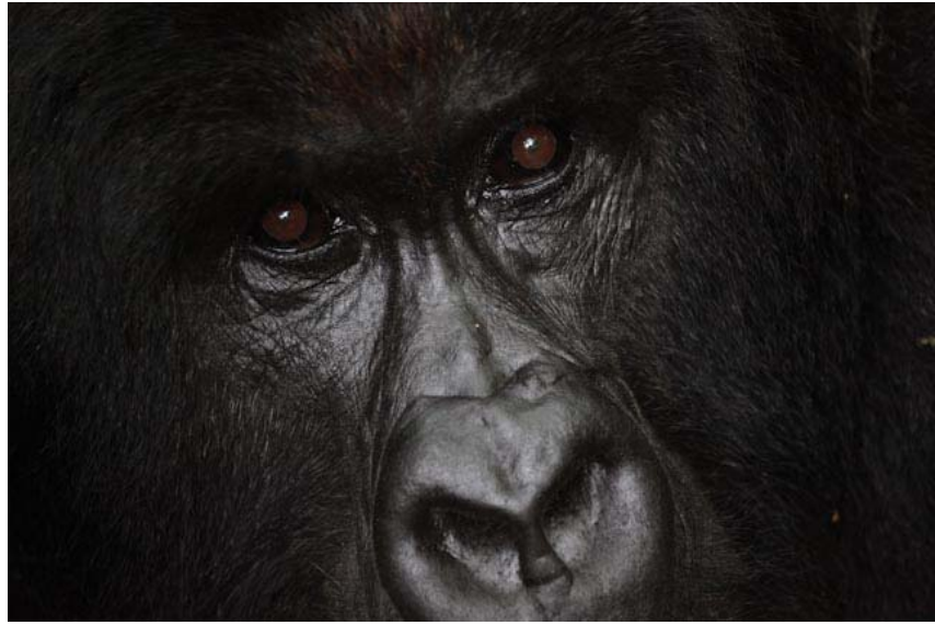
Der Silberrücken, stark und der Führer der Gruppe. Die Schwar zrücken werden diese Gruppe nicht so schnell übernehmen können!