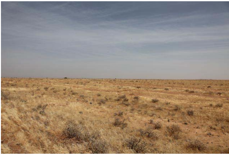
Das hier ist nämlich ne neu Wüste: die Kaisut Wüste.

Prima Pisten haben die hier, ich glaube jetzt wird es staubig.....schei.....!!!!!!