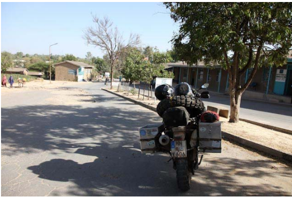
Art, und das ist die Trans Afrika!!!

Läuft nicht gut hier an der Grenze, die äthiopische Seite sollte seit 6:00 Uhr offen sein, aber sie machen erst um 08:00 auf, hätte also noch ausschlafen können, als hier zu warten!!!!