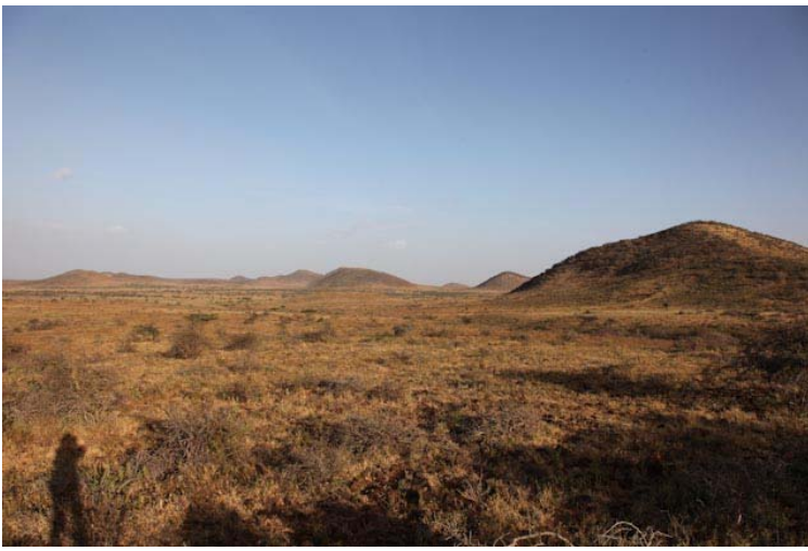
Die Sonne steht tief und der Muzungu mit seinem Moped ist bald in Marsabit.