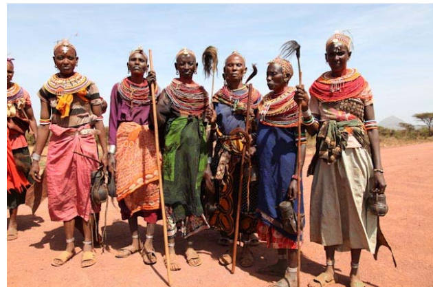
Die Massais, sind auf Wanderschaft, die Frauen auf jeden Fall die singen und haben ne mord's gaudie nem Muzungu Kohle für ein Foto abzunehmen. Aber: die werfen wenigstens nicht mit Steinen!!!