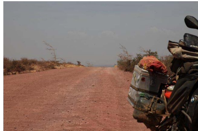
Wellblech auf ca. 100 km, das macht laune!!!