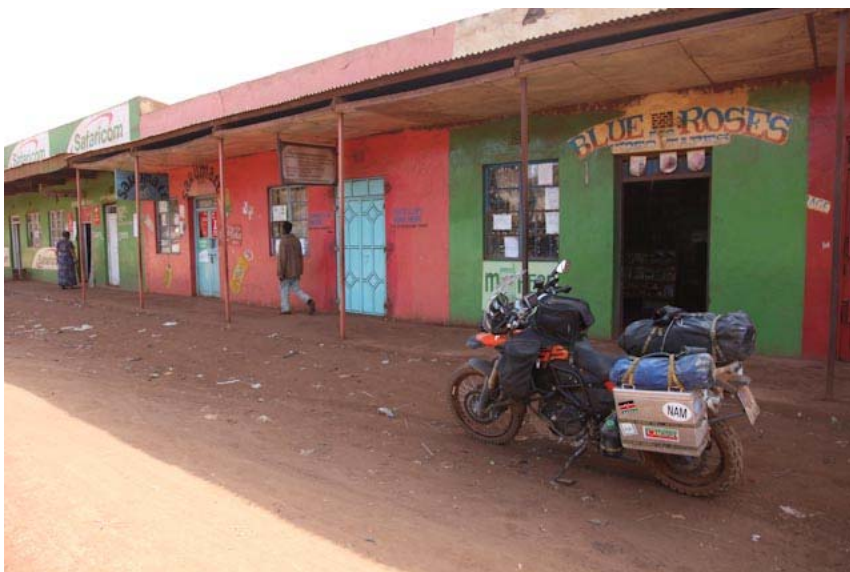
Das ist Marsabit, sieht nicht schlimm aus aber ich glaube ich muss jetzt weg!!!