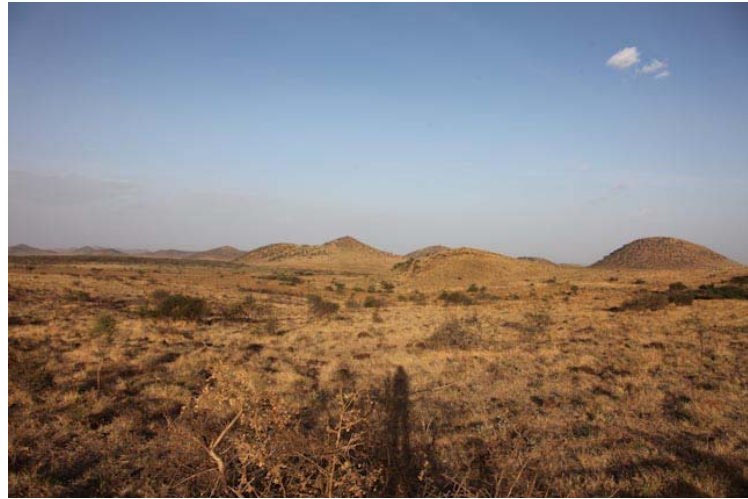
Diese Hügel sind alle vulkanischen Ursprungs, man kann das sich das so vorstellen wie bei einem Pfannkuchen der durch die Hitze Blasen schiebt, genau so war es hier.