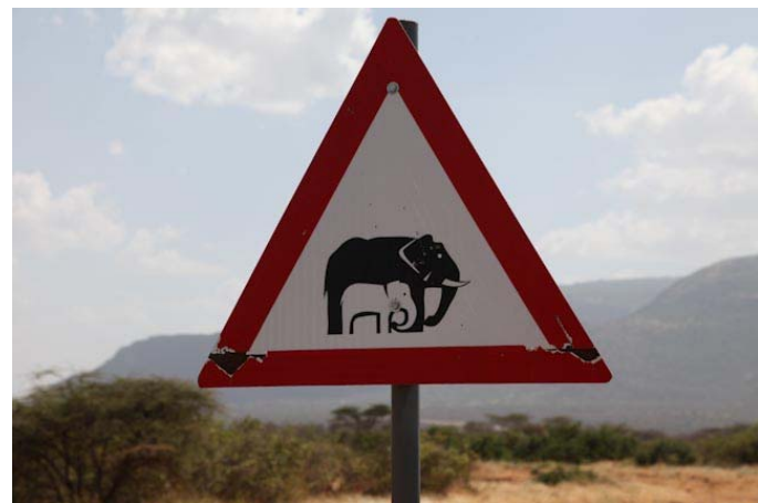
Zwei Elefanten hab ich gesehen, aber nur auf diesem Schild.