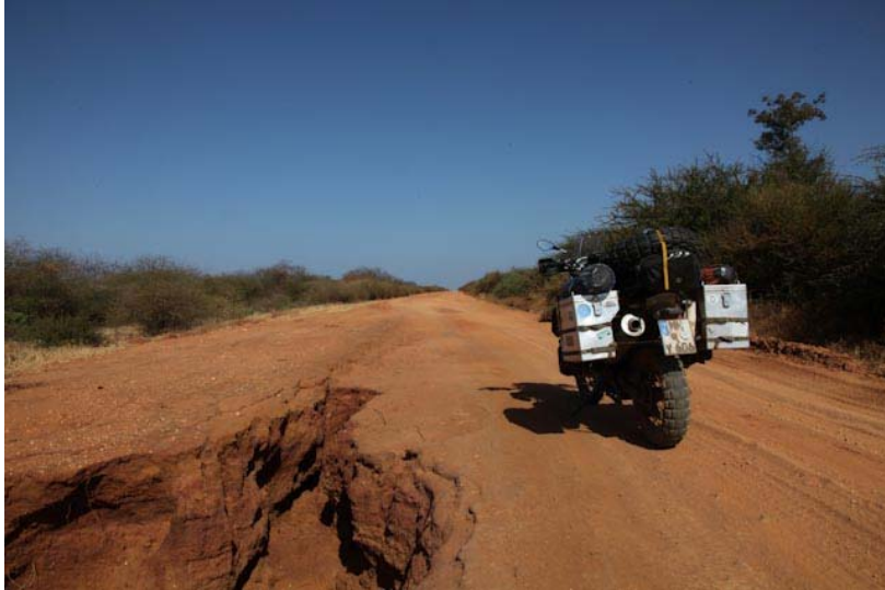
Um das neue Federbein nicht zu zerstören viele Pausen mit Bilder mit und ohne Moped.

Wenn man die Spalte in der Piste nicht rechtzeitig erkennt, könnte man auch darin stecken bleiben oder gar verschwinden.