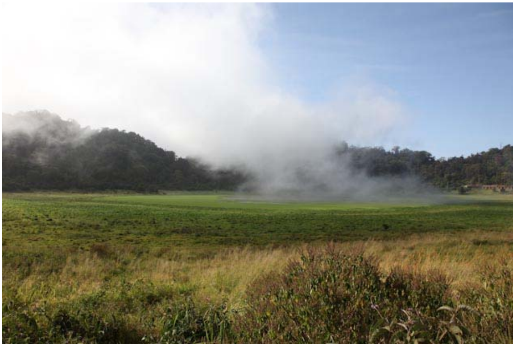
Kratersee bei der Marsabit-Lodge, habe erfahren, letzte Woche sind sechs Menschen bei Schießereien umgekommen, sind verschieden ethnische Gruppen die sich bekämpfen. Viel Polizei und Militär präsent!